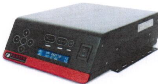
L'affichage et le clavier peuvent être tournés de 180° pour un montage mural. Veuillez spécifier "affichage inversé" lors de votre commande.

BOUSSEY CONTROL EUROPE - Jacob Lacopstraat 36 Bus 101 - 9700 Oudenaarde - Belgium