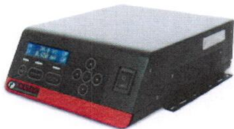
Position standard du support de fixation "banquette".

La gamme IONFIX a été conçue pour faciliter l'utilisation avec des supports pour un montage flexible.