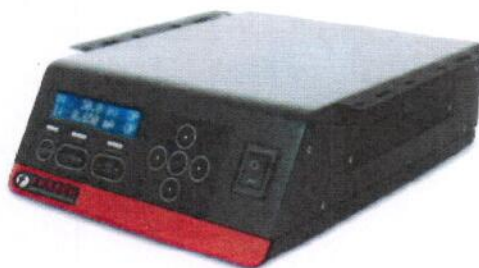
Les supports peuvent être montés pour permettre un montage "sous le banc"